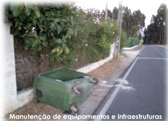
Manutenção de equipamentos e infraestruturas