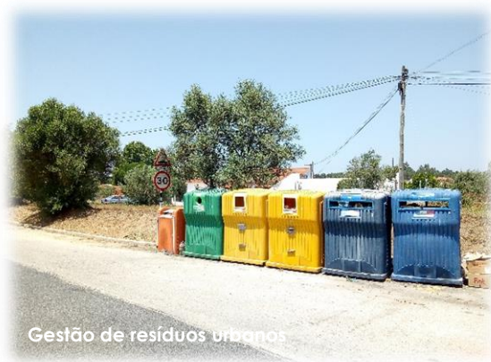
Gestão de resíduos urbanos