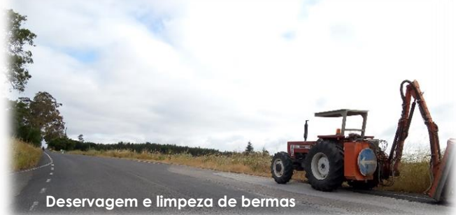
Deservagem e limpeza de bermas