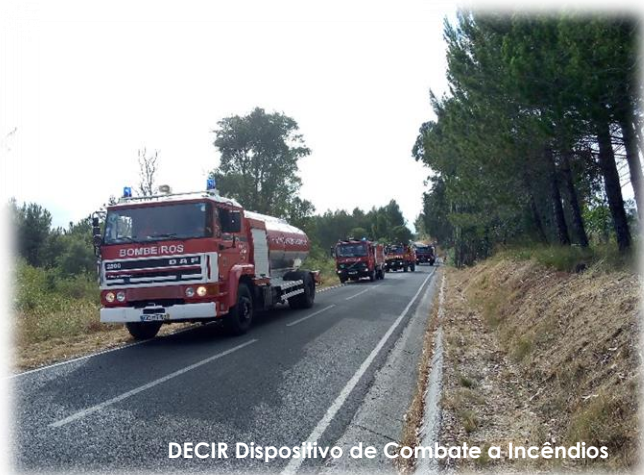
DECIR Dispositivo de Combate a Incêndios