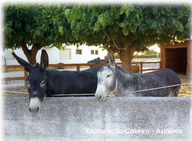
Exploração Caseira – Asininos