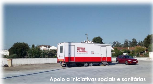
Apoio a iniciativas sociais e sanitárias