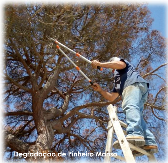
Degradação de Pinheiro Manso