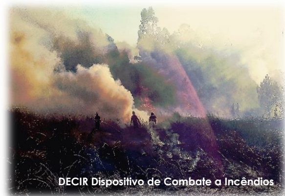
DECIR Dispositivo de Combate a Incêndios