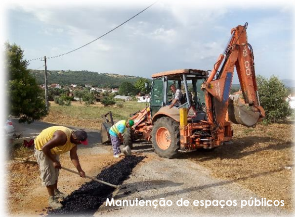
Manutenção de espaços públicos