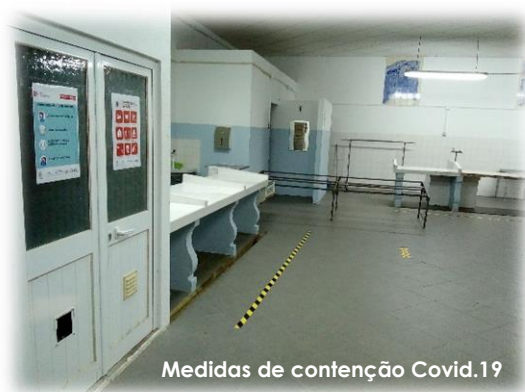
Medidas de contenção Covid.19