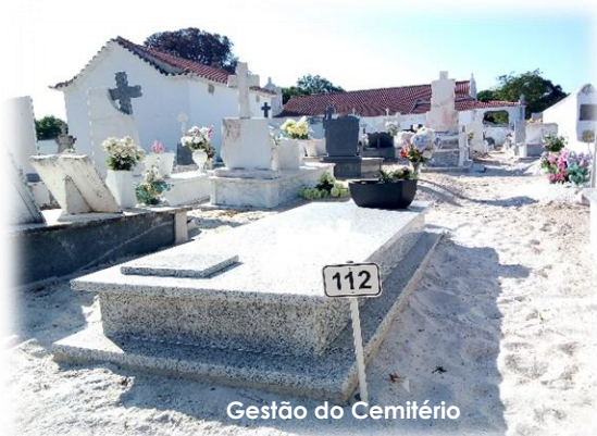
Gestão do Cemitério