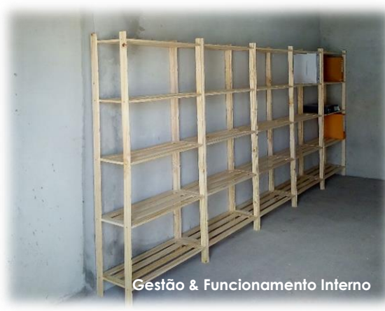
Gestão & Funcionamento Interno