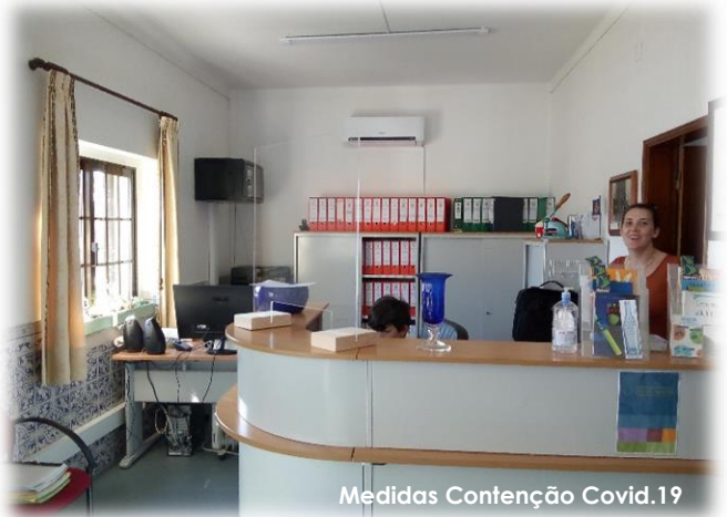
Medidas Contenção Covid.19