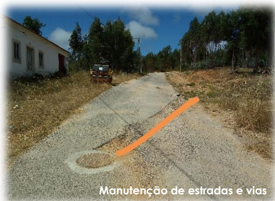
Manutenção de estradas e vias