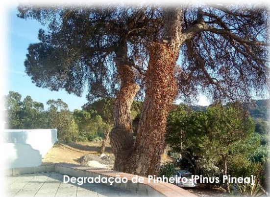
Degradação de Pinheiro [Pinus Pineal]