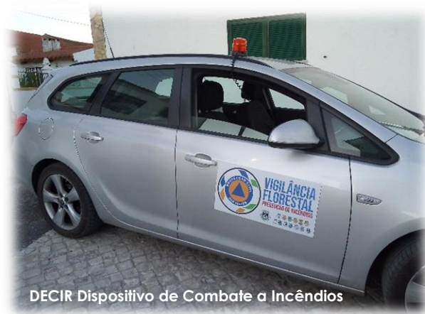
DECIR Dispositivo de Combate a Incêndios