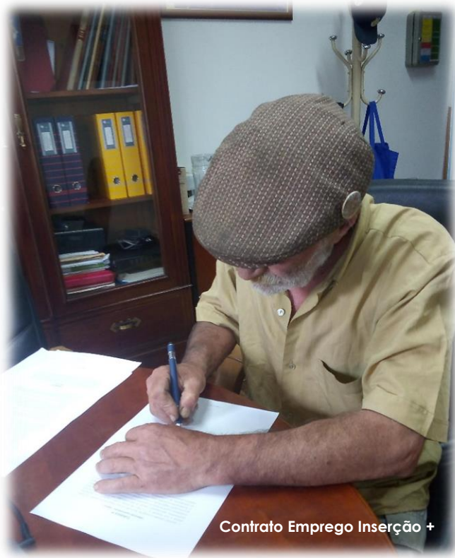
Contrato Emprego Inserção +