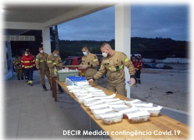
DECIR Medidas contingência Covid.19