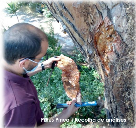
Pinus Pinea - Recolha de análises