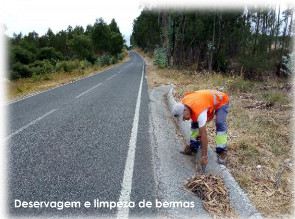
Deservagem e limpeza de bermas