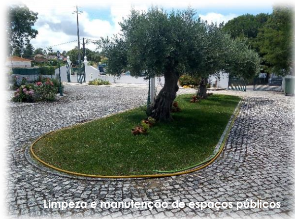
Limpeza e manutenção de espaços públicos