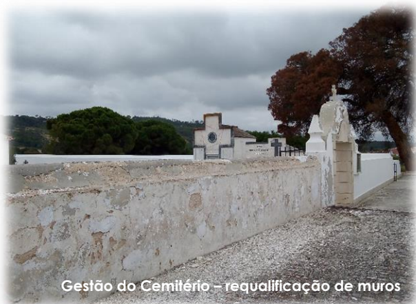
Gestão do Cemitério – requalificação de muros